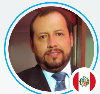
Gustavo Rivera Rivera Ferreyros Abogados